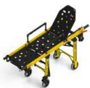
PC-650 CAMILLA CON FOWLER+TRENDELEMBURG STRETCHER WITH FOWLER+TRENDELEMBURG BRANCARD AVEC FOWLER+TRENDELEMBURG