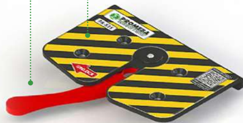
MANETA ERGONÓMICA DE DESBLOQUEO ERGONOMIC HANDLE RELEASE POIGNÉE ERGONOMIQUE DU DÉVERROUILLAGE