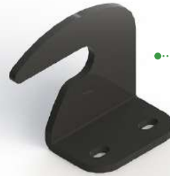
ANCLAJE MEDIANTE GANCHOS ANCHOR HOOKS FIXATION POUR CROCHETS