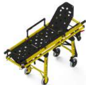
PC-675 CARRO-CAMILLA CON FOWLER+TRENDELEMBURG TROLLEY STRETCHER WITH FOWLER+TRENDELEMBURG CHARIOT ET BRANCARD AVEC FOWLER+TRENDELEMBURG

Todos los derechos reservados. Reservado el derecho a modificaciones sin previo aviso. All rights reserved. Variations can be done without notice. Tous droits réservés. Sous réserve de modifications sans préavis.