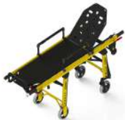
PC-610/7 CAMILLA CON TRENDELEMBURG STRETCHER WITH TRENDELEMBURG BRANCARD AVEC TRENDELEMBURG